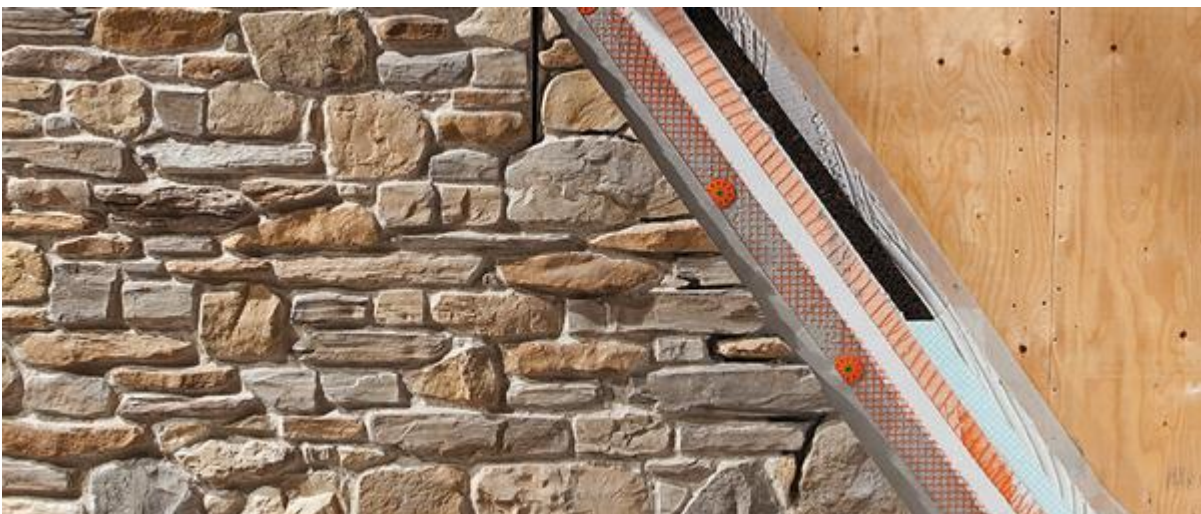
Esempio di posa in facciata di legno con cappotto esterno

La pietra e il mattone antico a vista hanno caratterizzato le nostre abitazioni, dapprima per esigenze costruttive, ultimamente per estetica. La difficoltà di reperire materiale di forma e dimensioni omogenee in cave, fiumi e cantieri ha fatto nascere l'idea delle pietre e dei mattoni ricostruiti. Utilizzando materie prime naturali si è arrivati ad ottenere un prodotto da rivestimento con caratteristiche visive identiche alle pietre ed ai mattoni originali. La facilità di posa ne permette a tutti l'utilizzo senza l'ausilio di imprese o artigiani specializzati.